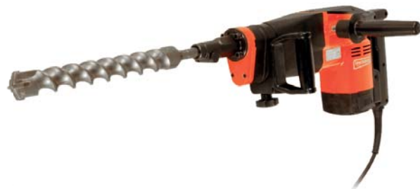
MARTILLO PERFORADOR PAG. 264