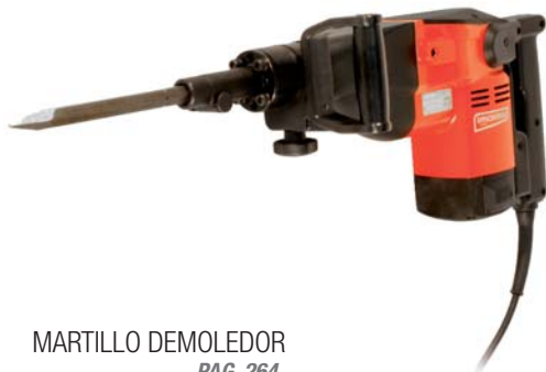
MARTILLO DEMOLEDOR PAG. 264