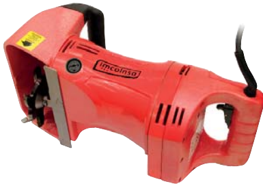
ROZADORA DE FRESAS PAG. 262