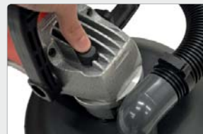
Fácil sustitución del consumible. Sistema de bloqueo del eje.