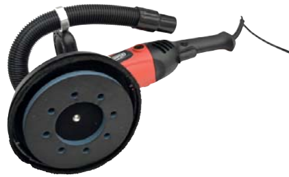
LIJADORA ELÉCTRICA PAG. 261