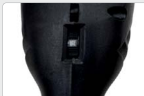
Módulo electrónico de control de velocidad para un ajuste progresivo.