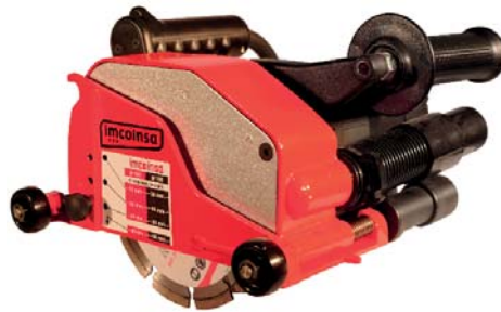
ROZADORA DE DISCOS PAG. 263