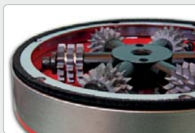
Regulación de la profundidad de ataque de 1 a 6 mm

Se entrega en dotación con caja metálica, cruceta de 6 aspas y juego de estrellas de widia.