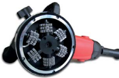
DECAPADORA DE FCHADAS PAG. 260